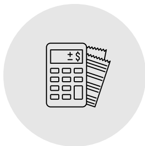
Service comptabilité d'une PME-PMI