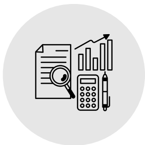
Cabinet d'expertise comptable