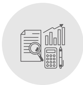
Cabinet d'expertise comptable