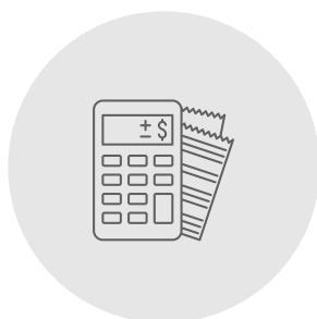
Service comptabilité d'une PME-PMI