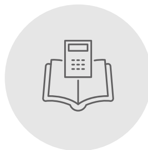
Service administratif et financier Grands Groupes