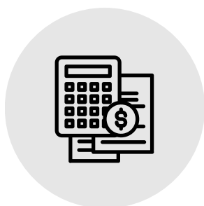
Service comptabilité d'une PME-PMI