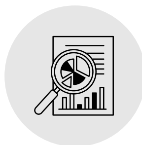
Service administratif et financier Grands Groupes